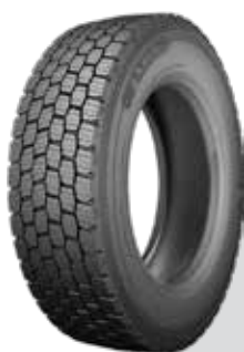
X® MULTI™ D