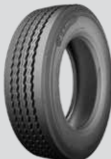
X® MULTI™ T