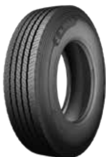
X® MULTI™ Z